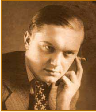
Lj. Vukadinović GVOZDENA PESNICA Opet milioner...