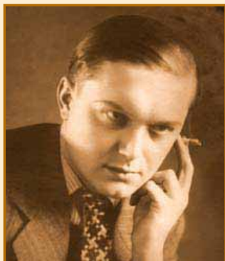
LJ. Vukadinović GVOZDENA PESNICA Dramatična borba...